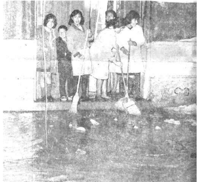
Las ventas se suspendieron anoche, en el comercio local, porque las empleadas tuvieron que trabajar de limpiar las puertas para evitar inundaciones y averías en las mercaderías.