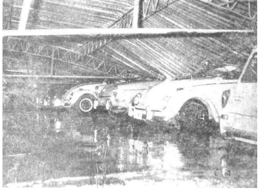
Estos elegantes autos sufrieron los impactos del estruendoso desplome del techo de calamina del galpón de Autos Huancayo S.A. que hoy comienza la tarea de recuperación.