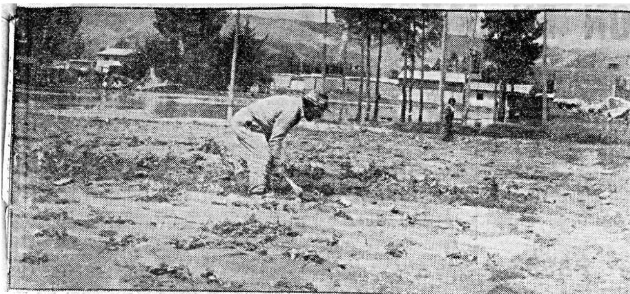
JAUJA (Correo).— u^ torrencial lluvia caula el mrereoles último en esta ciudad arrasó varias hectáreas de cultivos. Los daños aun no han sido evaluados.