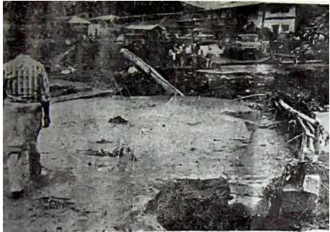
Un puente que fue construído por la comunidad de Cullhua, también fue destruído debido a la fuerza con que se impulsaban las aguas del Shullcas. Trabajadores de SEDA Junín, realizan trabajos acelerado para limpiar el canal que conduce agua hasta la planta de tratamiento de Vilcacoto; en tanto no se concluyen con estos trabajos pues el canal se encuentra con arena. La población de Huancayo no tendrá el líquido elemento en sus hogares