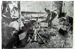
Más de dos mil damnificados necesitan con urgencia carpas, ropas, víveres y medicinas por lo trágico de haber tardado...

A dos mil llegan los damnificados además de 500 casas destruídas, a consecuencia de la intempestiva crecida del río Shullcas, registrada en horas de la tarde del último viernes, luego de una torrencial lluvia. Entre los más afectados se encuentran los pobladores del barrio de Pañaspampa, Acopaica, Vilcacoto, barrio Salcedo, barrio Manchago Muñoz y el asentamiento humano Santa Rosa. Las aguas que alcanzaron una altura de diez metros se llevaron vehículos motorizados triciclos, bicicletas, televisores; radios muebles y otros artículos más.