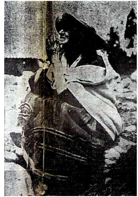
Mientras una anciana pide a Dios que le devuelva a sus hijos desaparecidos, una moderna madre de familia en compañía de sus tres menores hijos mira con tristeza cómo queda su vivienda totalmente destruída.