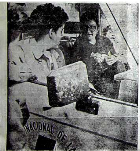
Personal de la Cruz Roja departamental de Junín, con el apoyo de la Internacional de Ginebra, apoyaron en la atención de los heridos, muchos de los cuales fueron conducidos a hospitales locales.