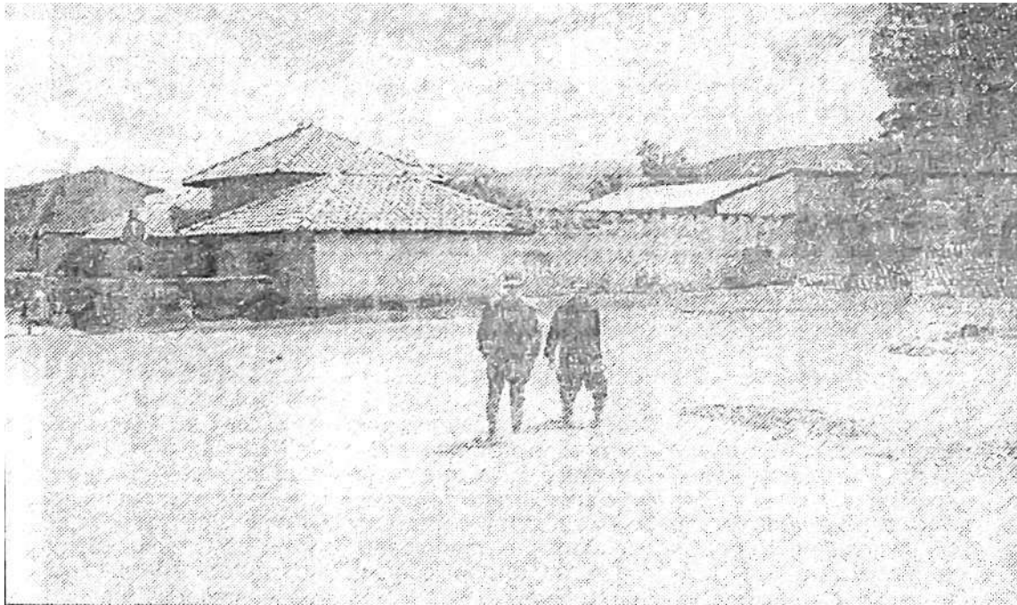
Las viviendas ubicadas en el barrio Yacus, en Huayucachi, fueron las más afectadas con las inundaciones.