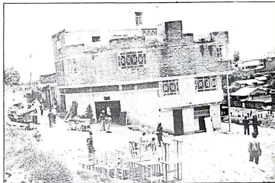
Las familiares que viven en las casas en peligro retiraron sus enseres por prevención.

"Pedimos que el presidente de la Región Caceres, los alcaldes provinciales y distritales, en coordinación con la Dirección de Transportes y Defensa Civil ejecuten las acciones