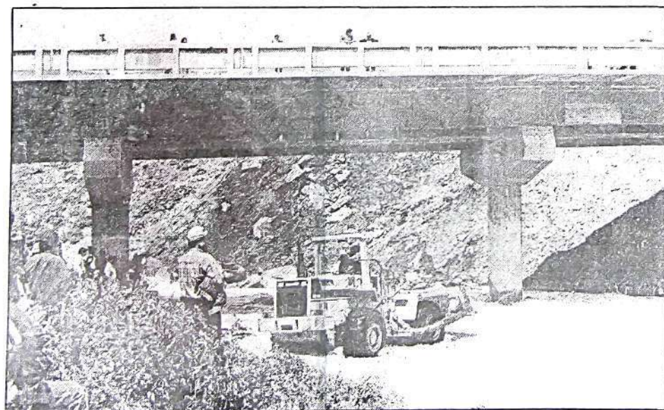
La municipalidad de El Tambo y la Dirección de Transportes comenzaron los trabajos de defensa.

Al prohibirse el tránsito vehicular por el Acueducto los choleros tenían que doblar el timón de sus vehículos hacia la calle Rea / la avenida Huancavelica provocando un "embotellamiento" motorizado. "Si se caen los puentes ya no podremos pasar al centro" indicó un pasajero.