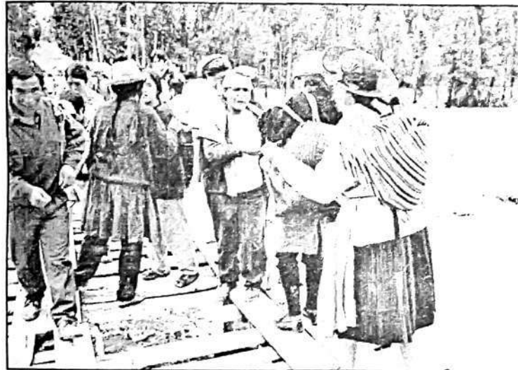
ABUSO. Los comuneros de Chanchas aprovechan la ocasión para cobrar peaje por pasar por el puente rústico.

I Aguas torrenciosas destruyen puente provisional