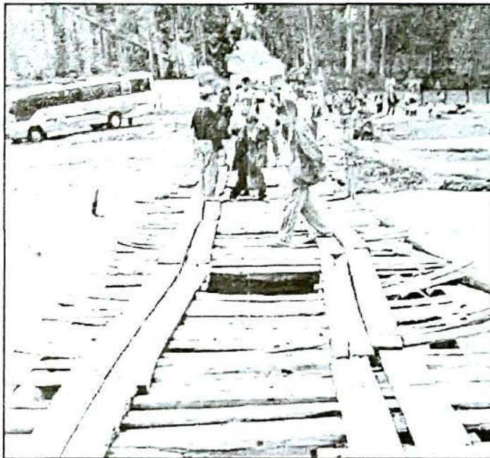
A PUNTO DE CAER. Ante el arrasamiento del puente provisional, la gente tuvo que apelar a un vetusto paso peatonal, que en cualquier momento se viene abajo.

cerca al río. Estas cementseras pertenecen a los comuneros de Huayllaspanca, Huari, Miluchaca, barrio Tambo, y sector de Chanchas.