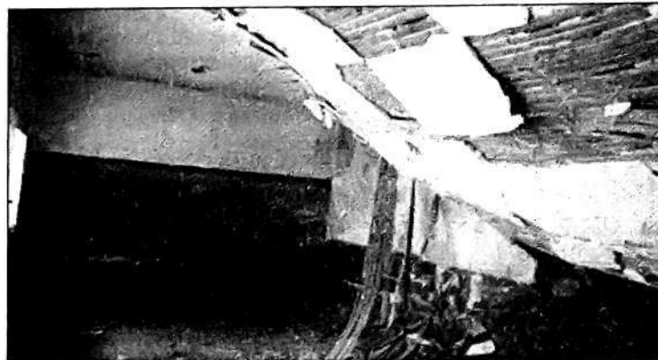
SOLO escombros. Pobre educación pública.