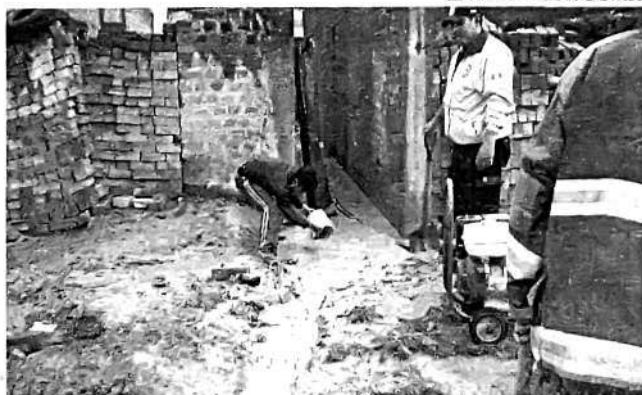
Viviendas están mal ubicadas