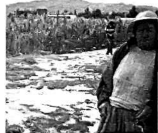
Aguas evitan cosecha